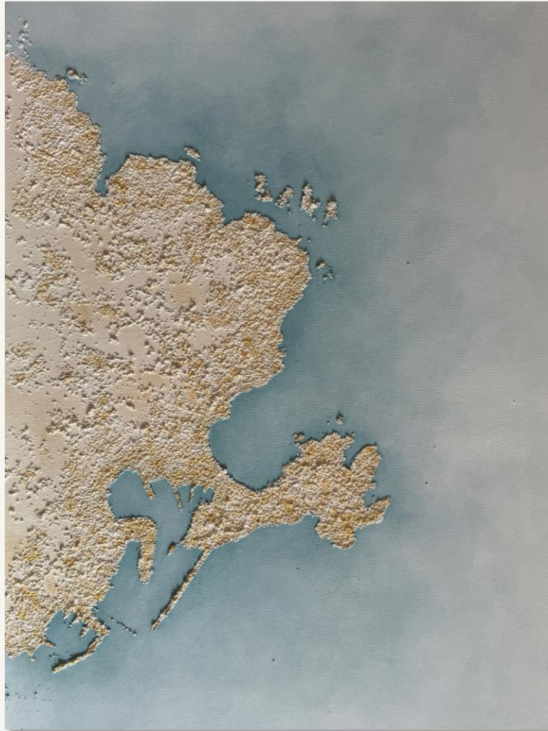
| CORUÑA | 80 x 60 cm Técnica mixta sobre lienzo de algodón. Bastidor de 2 cm.