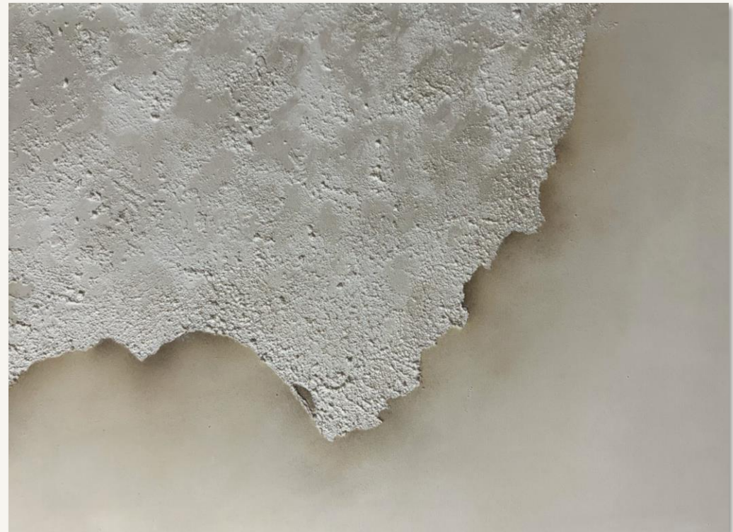
| ALMERÍA Y SYDNEY | 2X 60 x 80 cm Técnica mixta sobre lienzo de algodón. Bastidor de 2 cm.