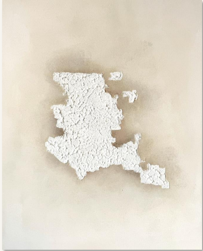
| MADRID + PARIS + LAS VEGAS | 3X 55 x 46 cm Técnica mixta sobre lienzo de algodón. Bastidor de 2 cm.