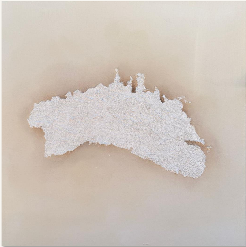
| MENORCA | 50 x 50 cm Técnica mixta sobre lienzo de algodón. Bastidor de 4 cm.