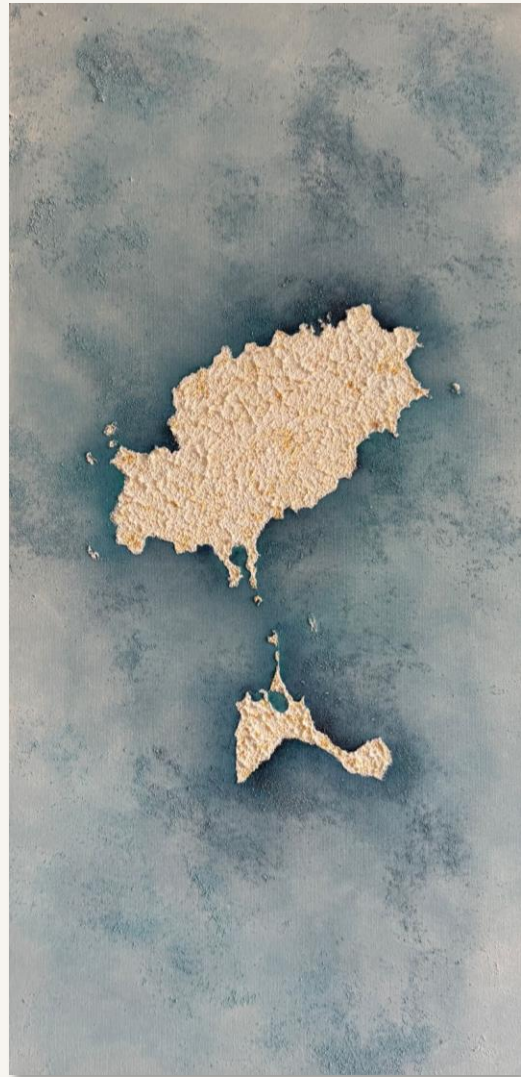
| IBIZA Y FORMENTERA | 80 x 40 cm Técnica mixta sobre lienzo de algodón. Bastidor de 2 cm.