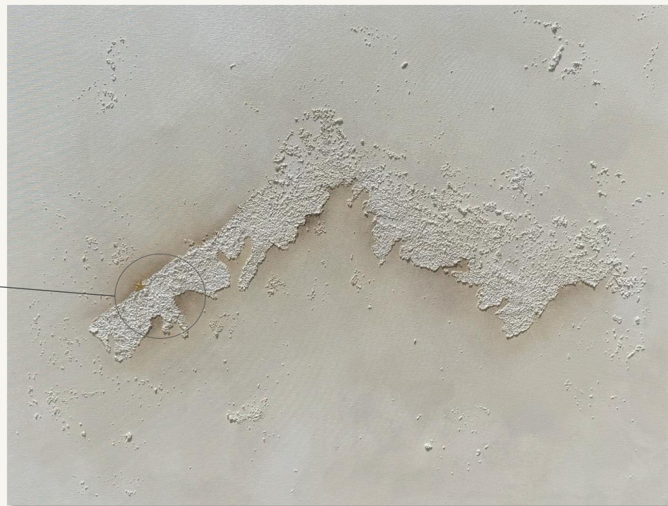
| DETALLE DE ISLA DE HOLBOX, MEXICO | 90x70 cm Técnica mixta sobre lienzo de algodón. Bastidor de 2 cm.